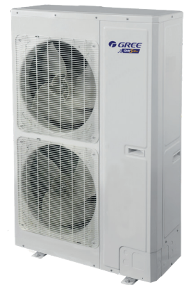
GMV-160 Mini VRF

Sisäyksikkömalleja on useita erilaisia ja eri tehoisia. Laajasta sisäyksikkömallistosta löytyy seinälle asennettavat mallit ja kattokasetit – aina tarpeen mukaan. Erikokoisiin tiloihin on saatavilla eri tehoisia sisäyksiköitä. Sisäyksiköt ovat tyylikkäitä ja huomaamattomia ja myös erittäin hiljaisia. Kutakin sisäyksikköä ohjataan omalla kaukosäätimellä. Lisäoptiona myös langallinen kaukosäädin.