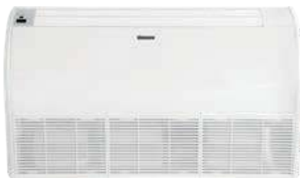
Sivulta puhaltava sisäyksikkö 70-A

GREEN kehittynyt invertteriteknikka mahdollistaa hyvän energiatehokkuuden. Nyt ympäristöystävällisellä R32 kylmäaineella.